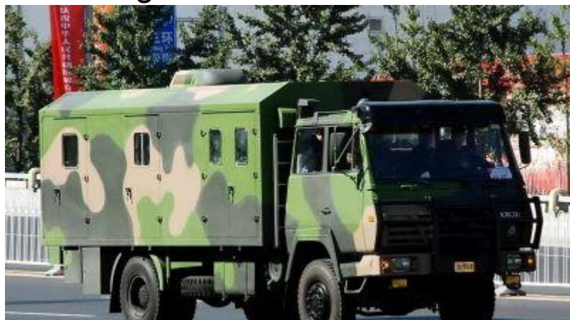
Xe tải quân sự Trung Quốc. Ảnh minh họa.

Ukraina đã thất bại trong chiến dịch phản công giành lại các vùng đất bị Nga chiếm trong năm 2023. Trong lúc công luận tập trung vào chủ đề các viện trợ quân sự không đủ mức của phương Tây cho Kiev, hoặc chiến thuật bị chỉ trích là sai lầm của quân đội Ukraina, hậu thuẫn của Trung Quốc cho Matxcova đã ít được chú ý hơn nhiều.